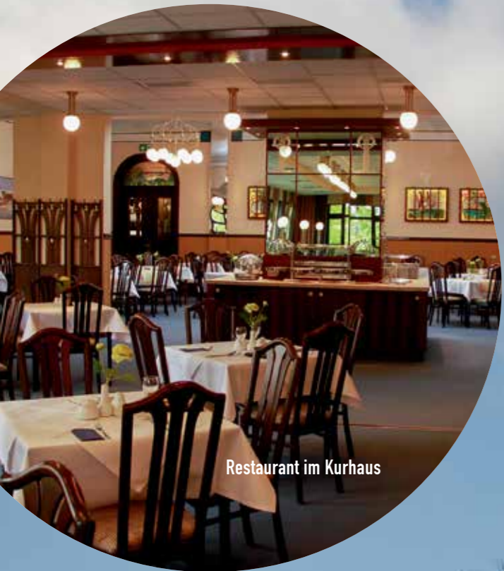
Restaurant im Kurhaus