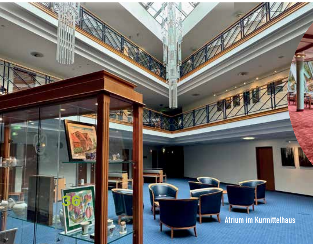
Atrium im Kurmittelhaus

Die Rehabilitationsklinik »Eisenmoorbad« verfügt über Apartments mit getrenntem Wohn- und Schlafbereich. Für Bucher dieser Apartments steht für die Mahlzeiten ein separater Speiseraum zur Verfügung.