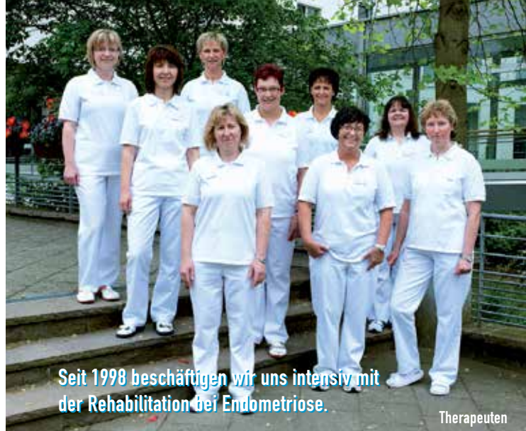
Seit 1998 beschäftigen wir uns intensiv mit der Rehabilitation bei Endometriose.